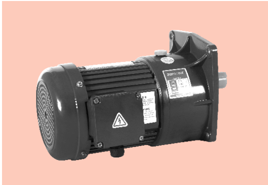
■ 立式 Vertical