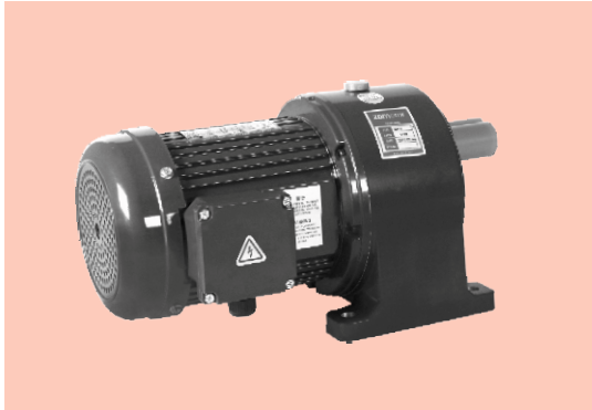
■ 卧式 Horizontal